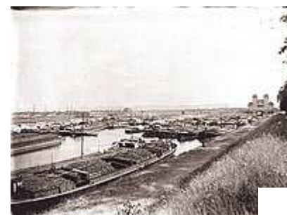
Gedränge am Unterhafen Schachtschleuse um 1930.

Das bedeutete Befestigen der Ufer und Konzentrieren der Strömung durch Buhnen. Ziel war eine durchgehende Wassertiefe von 1,00 m oberhalb und 1,25 m unterhalb