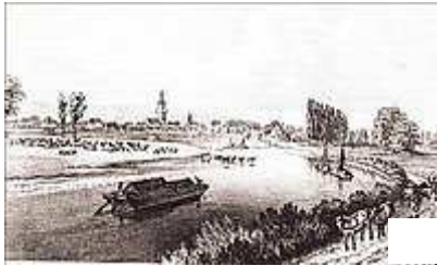
Frachtkahn bei Rinteln um 1800.