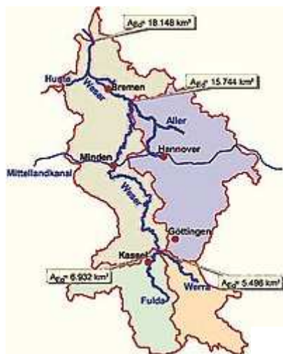
Das Einzugsgebiet der Weser. Grafik: Weserfreunde e. V.

Minden (mt). Was wollen die Weserfreunde? Eines der fünf Projekte heißt Weserinsel-Schöne Weser. Ziel ist es, die stark verbaute Weser in konfliktarmen Abschnitten wieder zu revitalisieren. Konfliktarm sind die Oberweser, auf der die Berufsschifffahrt zum Erliegen gekommen ist und die Petershäger Schleifen, die vom Schiffsverkehr frei sind.